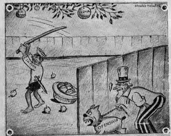
EL TIO SAM.—Yo creo que ya es hora de echarle el perro a ese saltador.